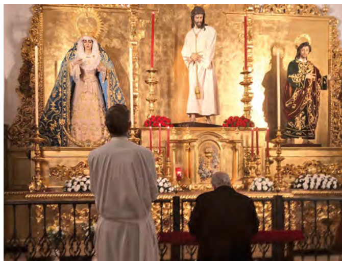
Monsenyor José Ángel Saiz Meneses en la Hermandad San Gonzalo.

L'oració de la pietat popular ens recorda un element que no hem d'oblidar, i al qual es refereix el papa Francesc en Evangelii gaudium (EG 124): « Crederè in Deum », és a dir, la confiança