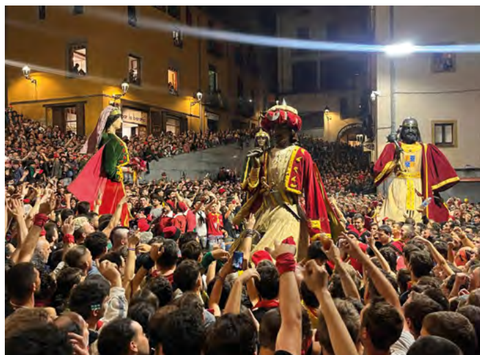
Fotografia: La Patum de Berga