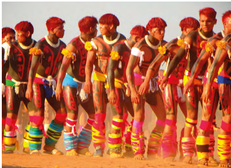
Joves Kalapalo en la celebració «Kuarup» per la mort d'una persona important per a la gent del parc Xingugena.

d'entrar gradualment al bosc per escapar dels invasors. A les dècades de 1970 i 1980, el govern militar va encoratjar la migració de sud i nord-est a la regió amazònica sota l'argument enganyós que, si els brasilers no l'ocupaven, altres nacions ho farien. Van repartir indistintament terres habitades des de temps immemorials i van expulsar-ne els pobles indígenes. Darrerament, amb l'avenç desenfrenat de la frontera agrícola i l'augment de les activitats mineres a la regió, molts pobles indígenes s'han vist obligats a emigrar als nuclis urbans. D'aquesta manera, els individus sobreviuen, però les seves cultures són assassinades. La desforestació no s'atura. Els incendis delictius consumeixen innumbrables quilòmetres de bosc cada any. El resultat és que el bosc, que abans absorbia CO 2 , ara també en produeix, alhora que l'escalfament global desencadena esdeveniments meteorològics extrems (sequeres, calor, fred, pluja...) per als quals no estem preparats. El crit profètic que ve de la ciutat i del camp ens ha de convertir globalment, fins que les situacions de mort que s'imposen a l'Amazònia trobin la resurrecció.