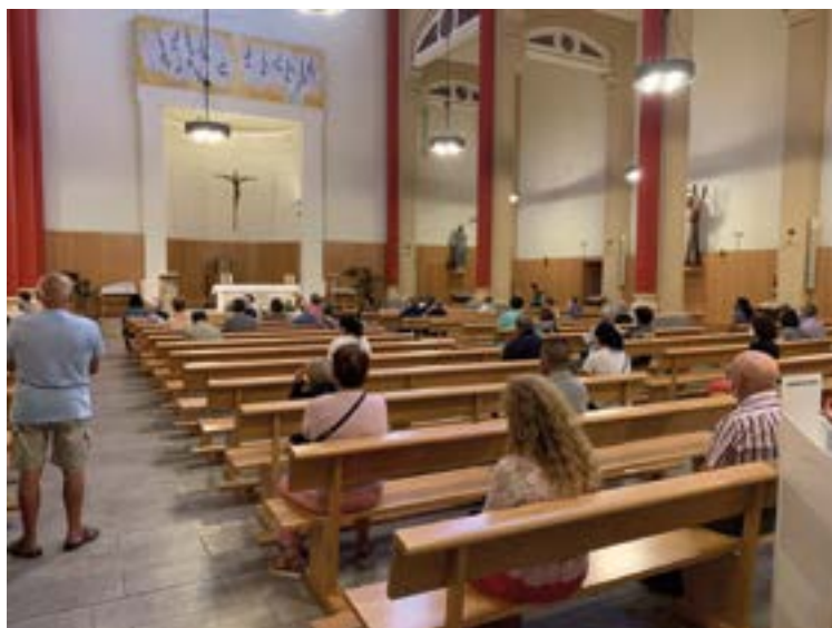
Fotografia: Santa Eulàlia de Vilapicina, Barcelona

Parròquia de Santa Eulàlia de Vilapicina (web)