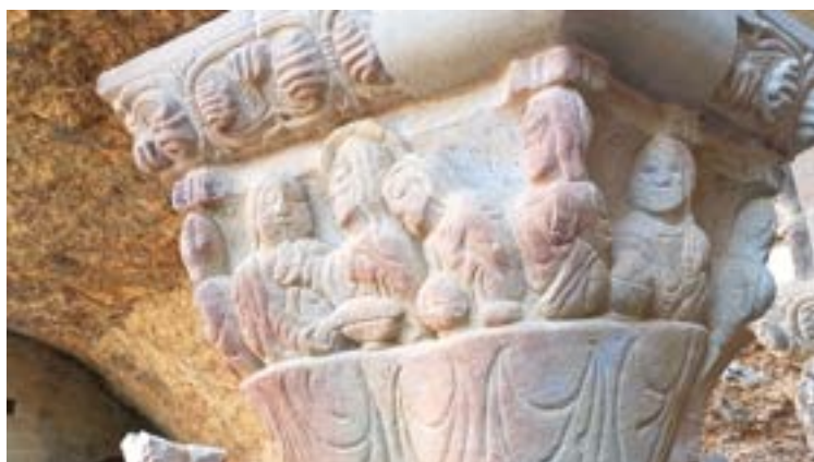
Fotografia: capitell del Monestir Vell de San Juan de la Peña

La celebració de l'Eucaristia i els sacraments –també podem dir-ho de l'Ofici diví– és una acció de tota l'Església, no una acció privada d'una persona concreta, sigui quin sigui el seu ministeri