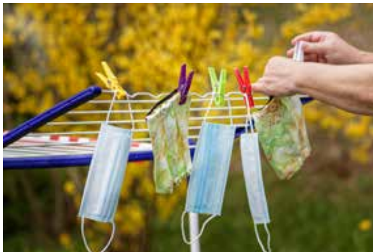
Fotografia de Willfried Wende a Pixabay

Passades les pitjors angoixes de la pandèmia, ens assetgen ara les preguntes: ¿quina petjada deixarà en nosaltres el que hem viscut durant aquests mesos?, ¿com gestionar el vendaval de sensacions i experiències?, ¿serem capaços d'aprofitar tantes lliçons de vulnerabilitat? Tenim dos camins per trobar respostes: un, a partir dels nostres hàbits de raonament i reflexió, apresos al llarg de molts segles de cultura occidental: observar, analitzar, abstenir, relacionar, treure conclusions.