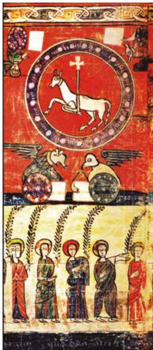
Fotografia: Anyell de Déu del Beatus de la Seu d'Urgell, del segle X, del Museu Diocesà d'Urgell

El darrer diumenge, el XXXIV del temps de durant l'any, amb la solemnitat de Crist Rei, tanquem l'any litúrgic celebrant que nostre Senyor és el Senyor de tots els sants, de tots els pobles i de tota la creació. I així donem pas a un nou inici, amb el temps d'Advent, que ens prepararà el Nadal.