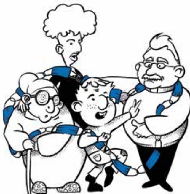
REPTES DE L'ESGLÉSIA DESPRÉS DEL CONFINAMENT