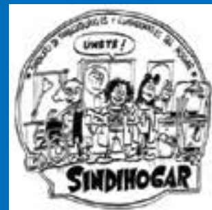
Sindihogar / Sindillar