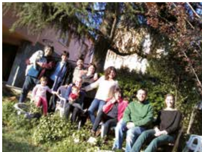
Fotografia: Recés de la comunitat; imatge cedida per Marta Moya.

L'any 2009, al barri de Sant Andreu del Palomar, Barcelona, vam començar formant una comunitat de vida vuit adults i tres menors repartits entre quatre pisos d'un mateix edifici, i un cinquè habitatge llogat entre tots que també vam destinar a un projecte social comunitari, d'acollida de dones en risc d'exclusió social. Des d'aleshores fins ara, la comunitat ha estat oberta a noves incorporacions i també hem viscut l'experiència d'algunes baixes. Aquests canvis i noves situacions ens han fet aprendre i créixer com a comunitat.